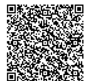
反射ベストに関する 補足説明