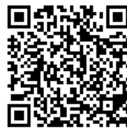
ランドヌール札幌 BRM 参加ガイド