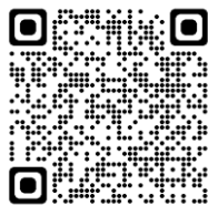
オダックスジャパン BRM/AJ 規定

すべて BRM 規定に基づいて実施いたします。 ブルベルールを下記オダックスジャパン Web 「BRM/AJ 規定」にて熟読ください。 また独自規定もございますのでランドヌール札幌サイト、「BRM 参加ガイド」もご参照ください。